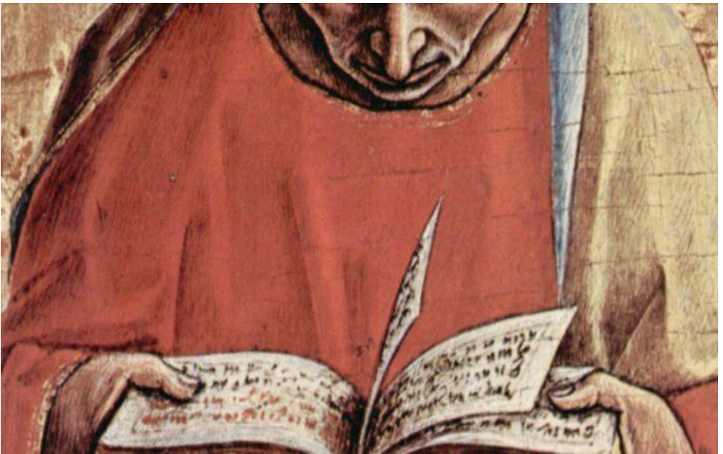
Een brevier of breviarium, boek met dagelijkse gebeden

Gereformeerde Kerk Rhoon, Hervormde Gemeente Rhoon en Protestantse Gemeente Poortugaal