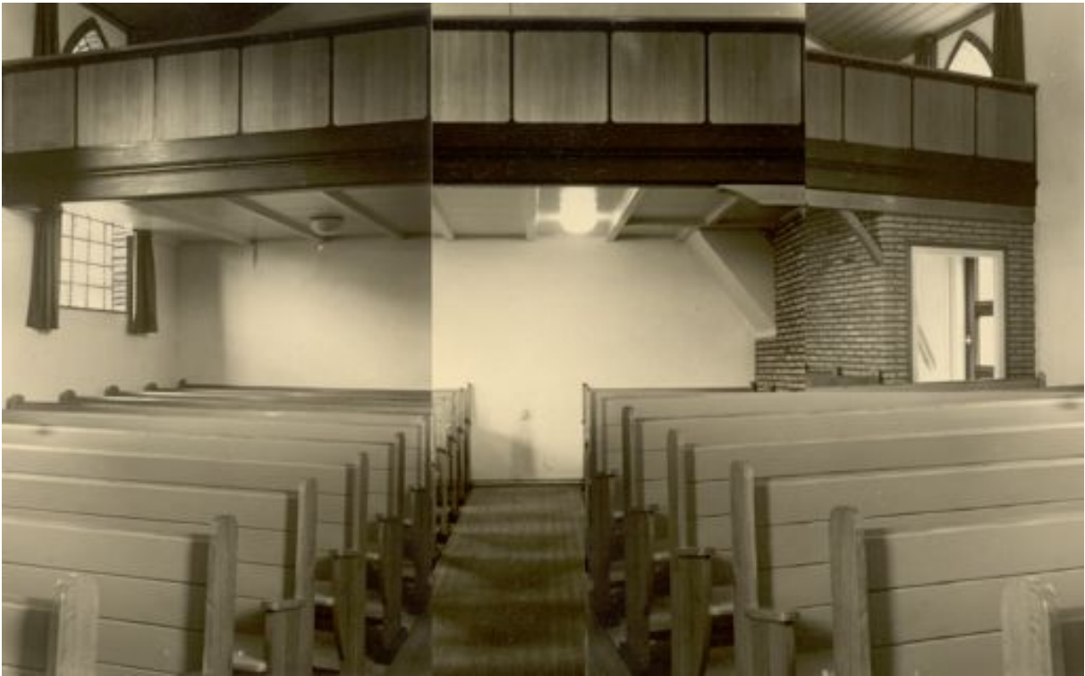
Kapel tot 1976 Voor de verbouwing, als kerk ingericht-balkonzijde