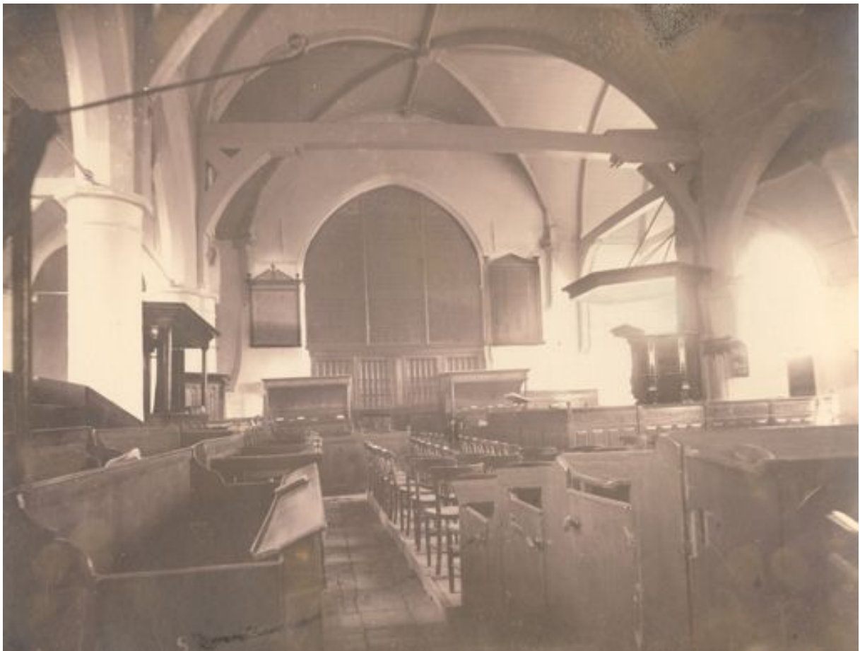
Hervormde kerk Poortugaal anno 1906