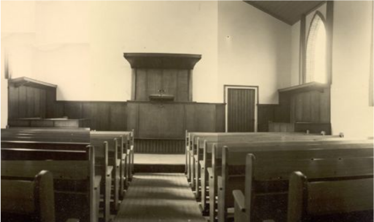
Kapel tot 1976 Voor de verbouwing, als kerk ingericht - voorzijde